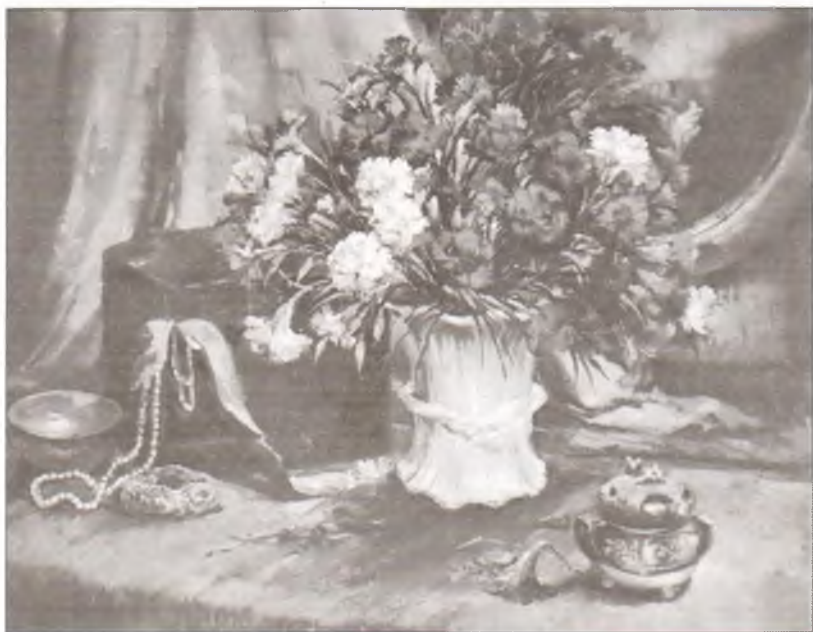
Гвоздики. Художник А. ван Несте. 1920-е гг.

дав подробное описание гвоздики, назвал её «Зевсовым цветком». В Древнем Риме гвоздики вручали воинам-победителям. В христианстве эти растения олицетворяли жертвенную материнскую любовь. По легенде, именно алые гвоздики выростали из слёз Богородицы, скорбевшей о гибели Христа.