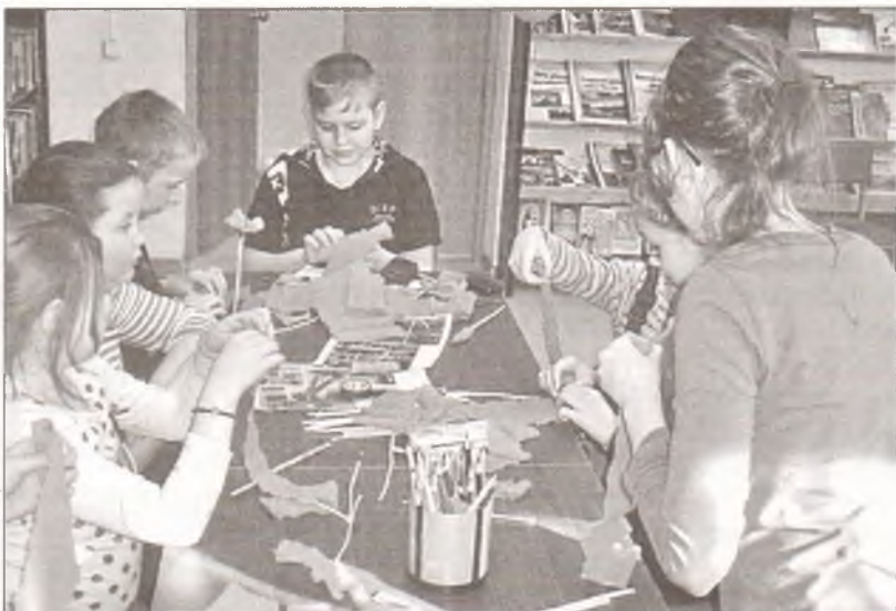
Основу бутона делаем из полосы красной гофрированной бумаги...

По внешней стороне наших заготовок делаем частые надрезы на глубину 2–3 сантиметра. (Демонстрирует.) Небольшой кусочек красной бумаги наматываем на тупой край шпажки и закрепляем скотчем. Это — серединка цветка. (Демонстрирует.) Надеваем на шпажку первый кружок-заготовку, делая в серединке небольшое отверстие. Аккуратно обминаем. (Демонстрирует.) Равномерно расправляем края цветка. (Демонстрирует.) Далее все те же действия повторяем с остальными кружками. Получится несколько раскрывшихся бутонов.