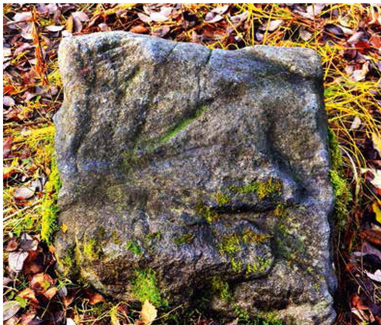
Обычный с виду камень хранит немало тайн, которые предстоит разгадать