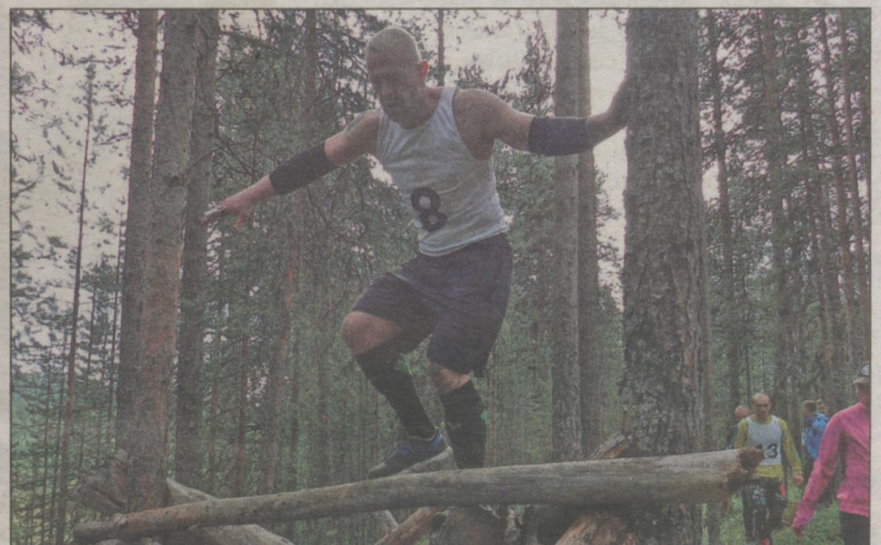
Экстремальный забег «Северные тропы».