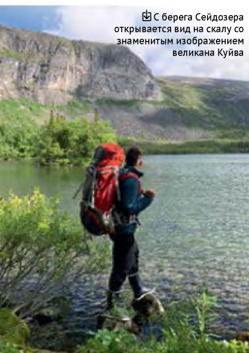
С берега Сейдозера открывается вид на скалу со знаменитым изображением великана Куйва

открытия, зачастую не надо отправляться на край света. Наверняка вы тоже в своих путешествиях встречаете много интересного. Расскажите о своих находках и впечатлениях, и мы обязательно напишем о них!