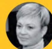
Марина Ковтун, губернатор Мурманской области:

– Туризм – одна из важнейших точек роста для Ковдорского района. Ковдор может стать местом притяжения для жителей не только нашей области, но и других регионов России. Здесь прекрасные возможности для развития природного, рыболовного, лыжного и горнолыжного и, в особенности, этнографического туризма. Конечно, придется позаботиться об инфраструктуре отдыха и развлечений, чтобы обеспечить гостям условия для передвижения, размещения и питания. Важным шагом на пути осуществления этих планов станет присвоение Ковдору статуса территории опережающего социально-экономического развития. Ресурсы для этого в районе имеются, осталось только получить этот статус и начать развивать город в тесном сотрудничестве с компанией «ЕвроХим», которая активно работает над проектом «Ковдор – столица Гипербореи».