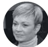
Марина Ковтун, губернатор Мурманской области:

Уже собраны интереснейшие фото- и видеоматериалы об уникальных и малоизученных древнейших артефактах Мурманской области. В ближайшее время в Ковдоре появится Сейд-парк с их каменными миниатюрами. В экспедицию уже собираются ведущие российские блогеры, чтобы своими глазами увидеть находки и рассказать о них российским и зарубежным туристам. Предстоит большая работа по развитию в Ковдоре туристической инфраструктуры: гостиниц, кафе, туристических баз, мест развлечений и транспортной логистики.