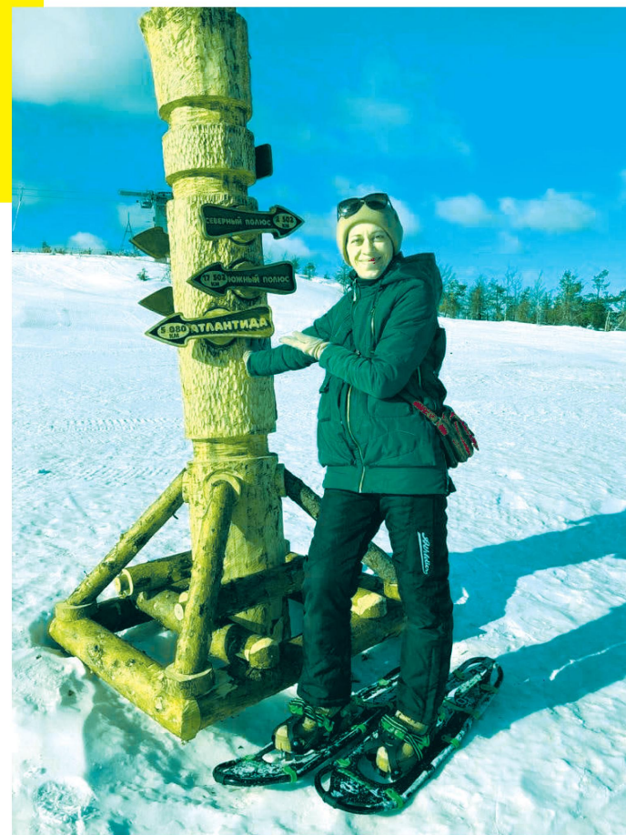
Первым туристам маршруты туроператора СП «Ковдорский» пришлось по душе!