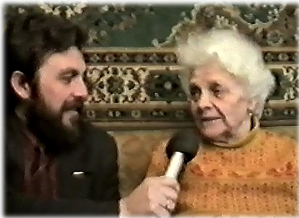
Стоп-кадр из видеосъёмки 1996 года

или на Ютьюбе: https://youtu.be/lx7tSanDuoU