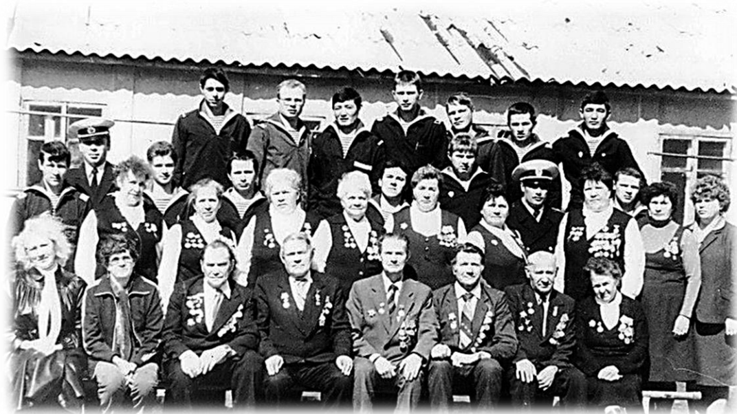
Встреча с моряками в Североморске. 1982 год.