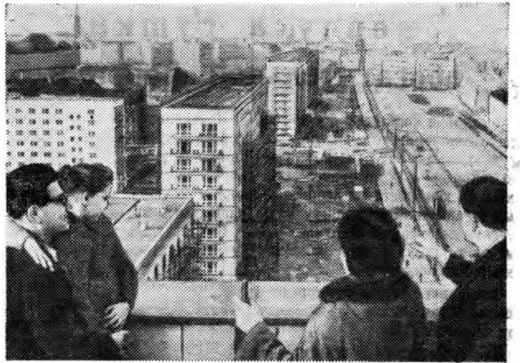
Германская Демократическая Республика. Вид на новостройки Карл-Маркс-алее в Берлине.

Эти данные приведены в документе «Историческая задача Германской Демократической Республики и будущее Германии», который летом этого года был принят в Берлине Национальным конгрессом.