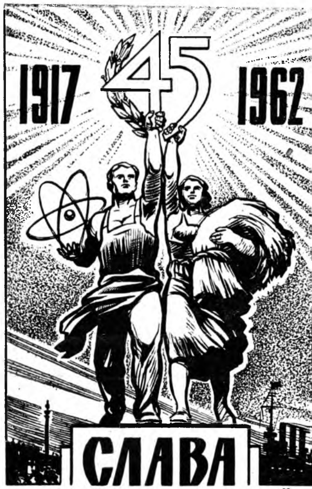
Плакат художника Б. Васильева.