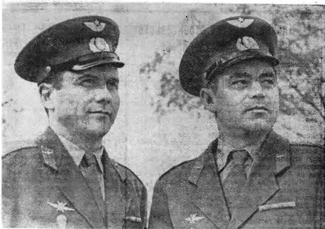
ЛЕТЧИКИ-КОСМОНАВТЫ А. Г. НИКОЛАЕВ (СПРАВА) И П. Р. ПОПОВИЧ.

Помня указания товарища Н. С. Хрущева о профсоюзах, цеховым профсоюзным организациям необходимо поднять уровень профсоюзной работы, вовлечь профсоюзный актив во все отрасли массовой работы.