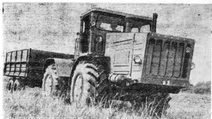
Ленинград. На Кировском заводе закончено изготовление двух опытных тракторов «Кировец».

Слабо идет запись молодежи в 5, 6 и 7 классы. Нужно партийным, профсоюзным и комсомольским организациям оказать помощь в укомплектовании школы рабочей молодежи.