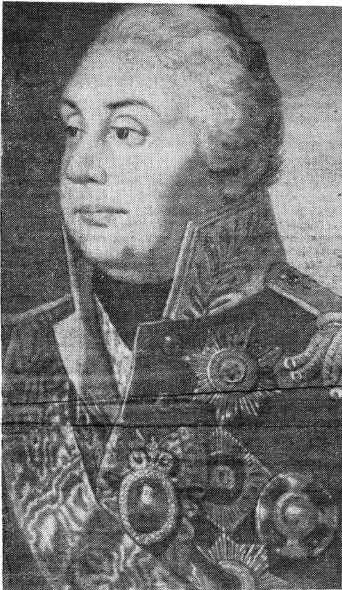
Великий русский полководец Михаил Илларионович Кутузов (1745—1813 гг.).

Первые два с половиной месяца войны русская армия отступала. Но вот в войска прибыл новый главнокомандующий — 67-летний генерал М. И. Кутузов. Ученик Суворова, крупнейший военачальник, он был облечен всеобщим доверием. Армия ликвала. «Приехал Кутузов битъ французов» — шутили солдаты.