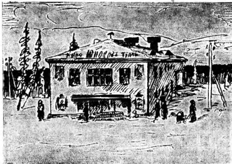
КОВДОР. Для жителей Ковдора в 1962 году был построен кинотеатр «Юность». Рис. А. Кузнецова.

С. Е. ПЕТРОВ. Начальник энергоцеха горнообогатительного комбината.