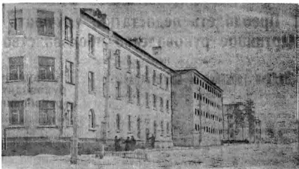
Поселок Ковдор. Парковая улица.

Социалистическое обязательство обсуждено и принято на собрании партийно-хозяйственного актива комбината 28 января 1963 года.