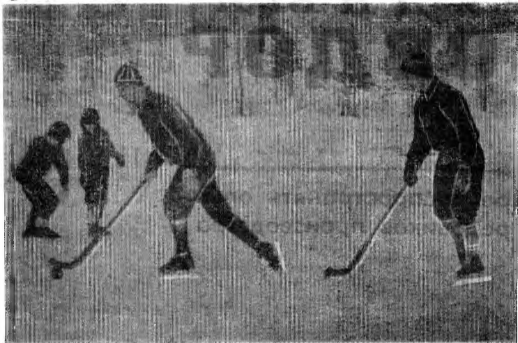
КОВДОР. Спортивное поле стадиона расчищено от снега и залито водой. Получился хороший каток. Он стал излюбленным местом молодежи. Здесь идут развлечения не только днем, но и вечером. Свободные от работы и учебы

молодые люди сюда приходят на тренировки. Оживление длится до позднего вечера.