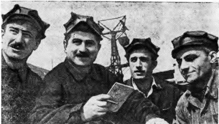
ГРУЗИНСКАЯ ССР. Ни одной отстающей смены, ни одного участка, не выполняющего задания, — такую задачу поставили перед собой горняки рудоуправления имени Калинина треста «Чиатурмарганец».

Вот это как будто мелочи, но они все время сдерживают работу монтажников. Время для окончания работ осталось считанное и нужно всем организациям, занятым на работах второй очереди фабрики, усилить темпы работ и своевременно ввести мощности в строй.