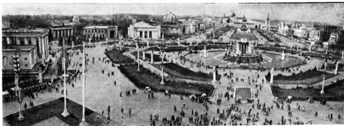
Пять лет назад (16 июня 1959 г.) в Москве была открыта постоянная Выставка достижений народного хозяйства СССР.