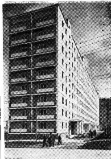
Москва. За какие-нибудь три месяца вырос в проезде Ольминского красивый 9-этажный дом. Он был собран из вибропрокатных деталей.

Скоро на улицах столицы появятся новые 12- и 18-этажные здания, собранные из вибропрокатных деталей полной заводской готовности.