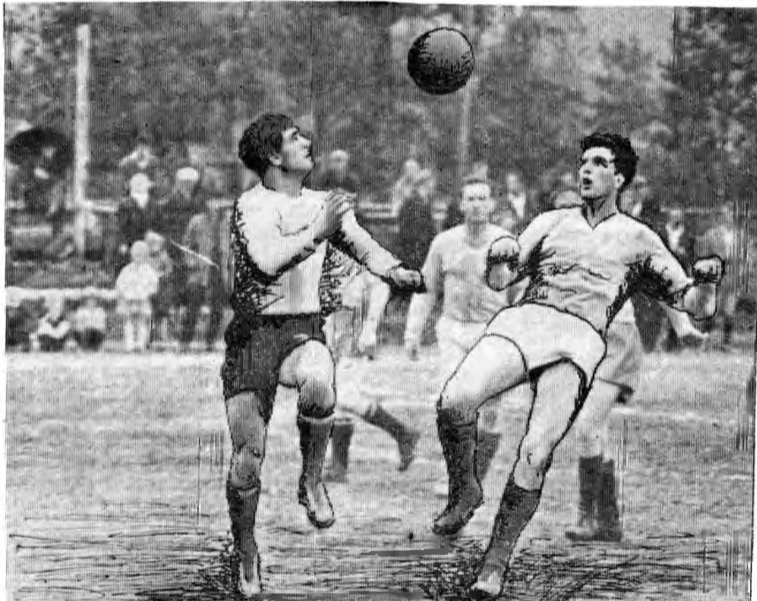
В один из воскресных дней июля на стадионе поселка Ковдор проходила футбольная игра между сборной командой «Строитель» и командой «Апатитстрой». Победили хозяева поля со счетом 2:0. На снимке: момент футбольной игры.