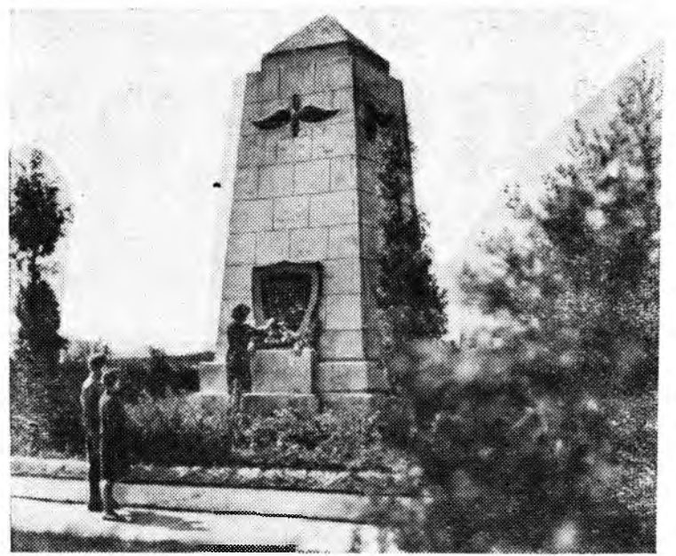
ЛЬВОВСКАЯ ОБЛАСТЬ. 8 сентября 1964 года исполняется 50 лет со дня беспримерного, по тому времени, подвига П. Н. Нестерова. В воздушном бою выдающийся русский летчик впервые в мире применил таранный удар, уничтожив самолет противника. Отважный сын России в этом бою погиб. Его подвиг во время Великой Отечественной войны повторили многие советские авы.

Отважного летчика народ не забыл. Его именем назван город, вблизи которого он погиб. На месте свершения подвига у села Воля Высокая установлен обелиск, в колхозе имени Нестерова — бюст героя.