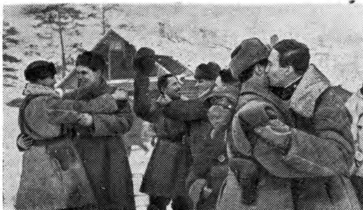
Блокада Ленинграда прорвана!

та депутатов трудящихся и городского комитета Коммунистической партии отдать все силы делу обороны родного города защитники Ленинграда дали гордую клят-