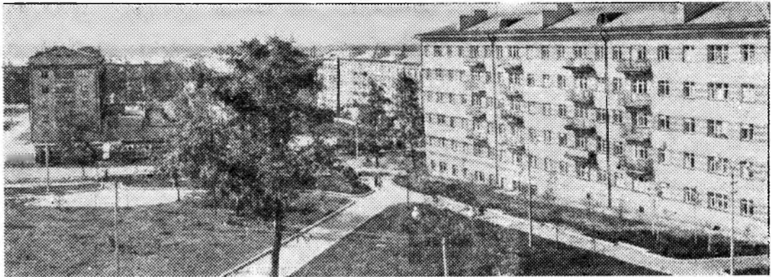
30 лет назад (28 декабря 1934 года) Удмуртская автономная область была преобразована в АССР. На снимке: Ижевск—столица Удмуртской АССР. Новый жилой массив на улице Труда.