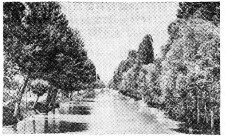
31 декабря исполняется 25 лет со дня открытия (1939 г.) Большой Ферганский канал.