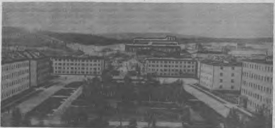
КОВДОР. С каждым годом хорошеет поселок. Благоустраиваются улицы. Жители Ковдора много труда затратили на озеленение поселка. На снимке: площадь имени Ленина.

Кроме того, наиболее активные участники в работе общественных бюро и групп экономического анализа награждаются Почетными грамотами и отмечаются творческими командировками на предприятия других городов.