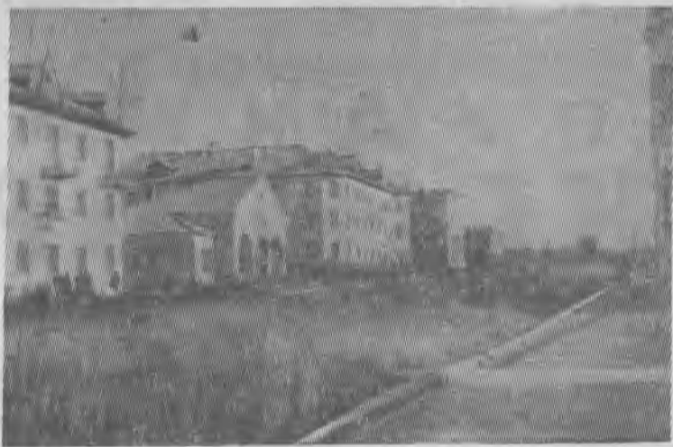
Ковдор, улица имени Ленина в солнечный день.