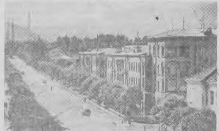
АРМЯНСКАЯ ССР. Растет и хорошеет молодой город армянских химиков — Кировакан. За последние годы несколько новых магистральных улиц вписались в городской пейзаж.

На снимке: новая магистраль города — проспект имени Ленина.