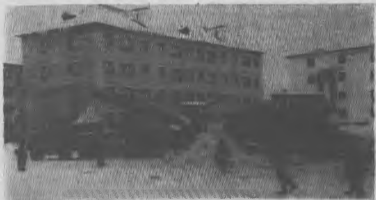
КОВДОР, площадь имени Ленина. Такой снежной зимы не было давно.