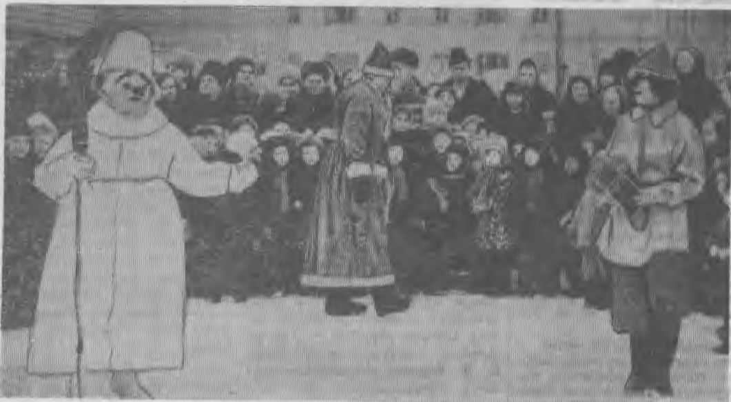
Весело детям с Дедом Морозом, снежной бабой и Емелюшкой.

Ковдорскому ГОКу срочно ТРЕБУЕТСЯ квалифицирован- ная машинистка для работы в управлении комбината. Обра- щаться в отдел кадров.