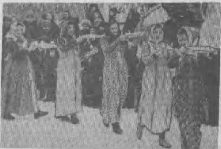
А вот появились и блины...сейчас будет угощение.