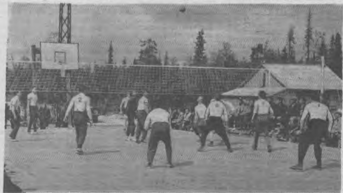
Первенство оспаривают волейболисты Ковдора и соседней.