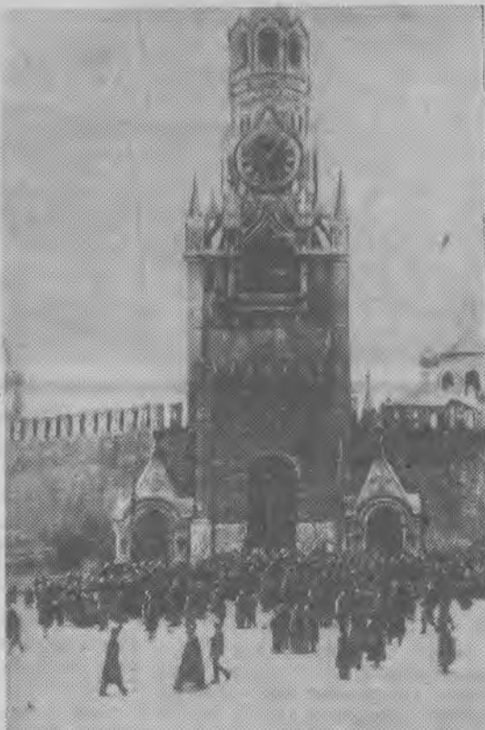
Москва, ноябрь 1917 года. Кремлевские куранты со следами повреждений после обстрела в дни октябрьских боев 1917 года.