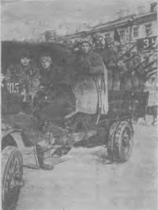
Петроград. 1917 год. Отряд революционных солдат.

ФОТОДОКУМЕНТЫ ИЗ ИСТОРИИ ВЕЛИКОГО ОКТЯБРЯ