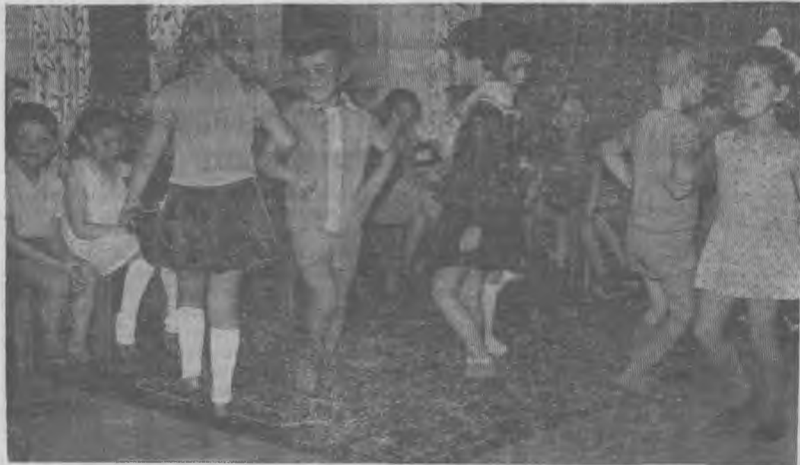
На снимке: выступление художественной самодеятельности воспитанников детского сада-яслей «Аленушка» на юбилейных торжествах.