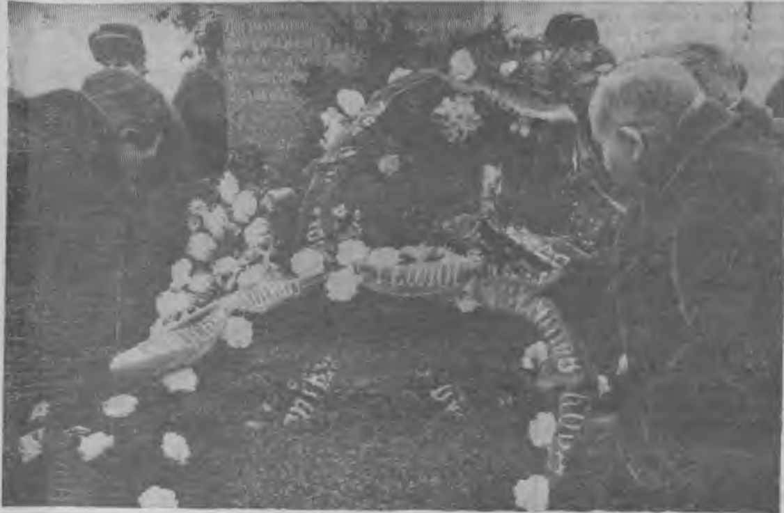
23 февраля состоялось возложение венков на могилу тех, кто в годы Великой Отечественной войны своей грудью защищал Заполярье. Почтить память погибших пришли горняки и обогатители, лесорубы и строители, железнодорожники и учащиеся. Здесь прошел митинг горжан. С речами выступили бывшие воины Советской Армии. На снимке: возложение венков.