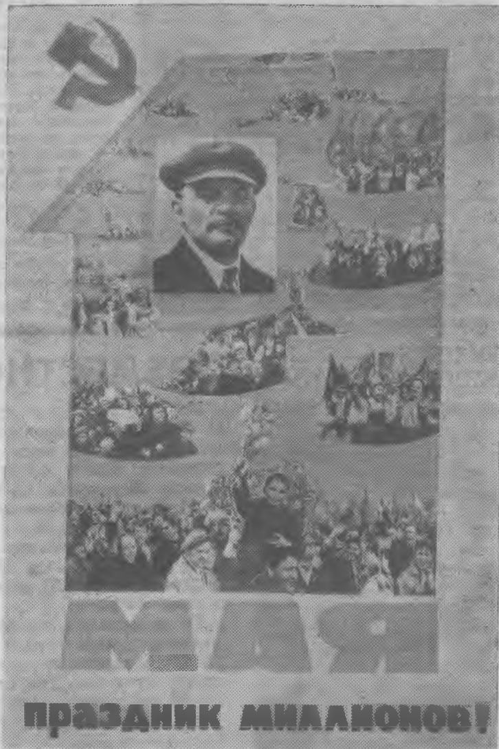
Планат издательства «Советский художник»

Профсоюзный актив Ковдорского куста одобрил и принял к неуклонному исполнению решения XIV съезда профсоюзов СССР, а также наметил ряд мероприятий по претворению в жизнь решений съезда.