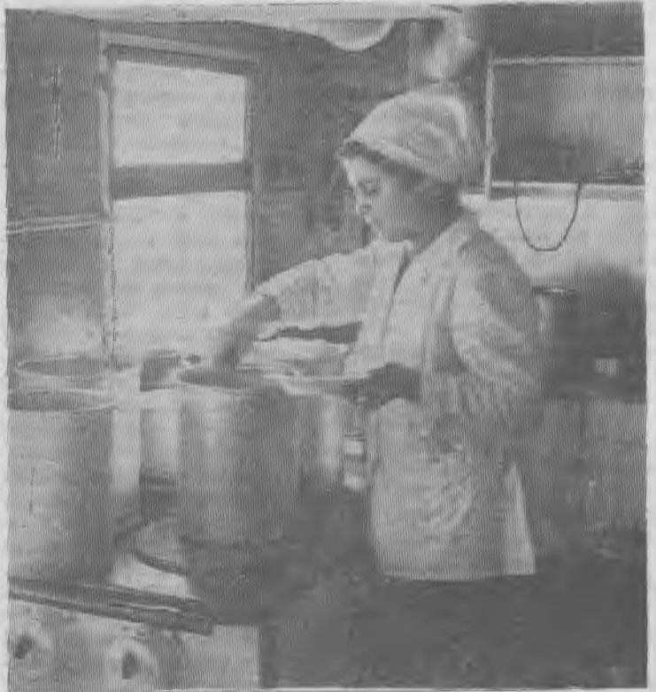
Передвижную столовую приобрел недавно комбинат. Новая столовая установлена около диспетчерской рудника «Железный». Здесь организовано питание шоферов цеха технологического транспорта и экскаваторщиков.

На снимках: обеденный зал и кухня новой столовой.