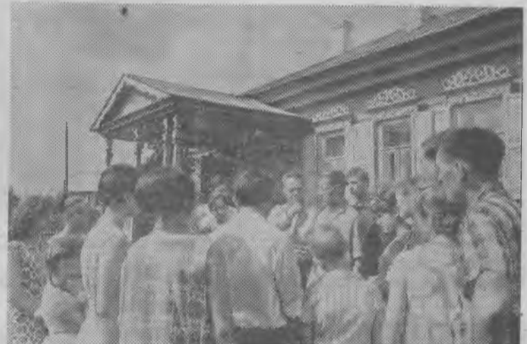
Куйбышевская область. Экскурсанты около Дома-музея В. И. Ленина в селе Алакаевке. Здесь семья Ульяновых жила в летние месяцы 1889—1893 годов.

Теперь в этом здании находится Куйбышевский областной суд.