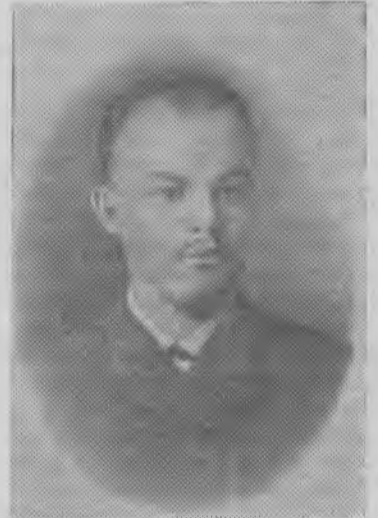
В. И. Ленин в студенческие годы. Самара 1890 г.

дом накопления сил для дальнейшей борьбы. В августе 1893 года Владимир Ильич переезжает в Петербург — крупный промышленный центр, где были сосредоточены большие массы пролетариата.