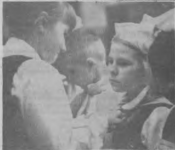
Состоялось торжественное собрание, посвященное юбилею Ленинского комсомола.