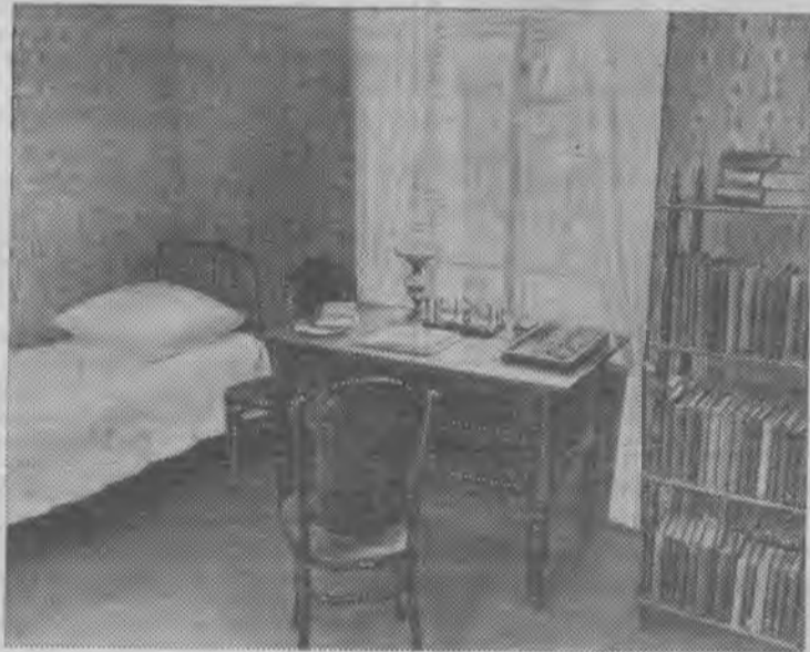
Куйбышев. Комната Владимира Ильича в Доме-музее В. И. Ленина. В этом доме семья Ульяновых жила в 1889—1893 гг.