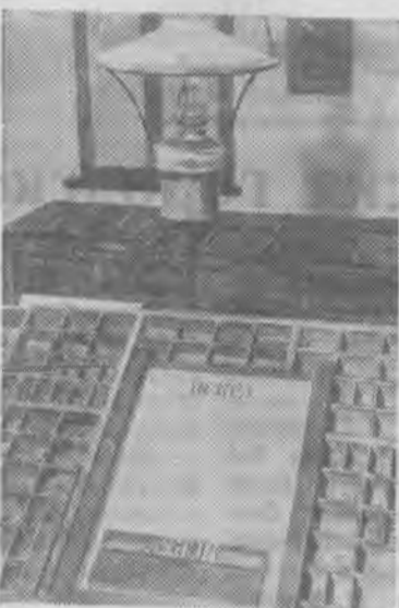
Лейпциг. Наборная касса и копия первой полосы первого номера «Искры» в помещении бывшей типографии, где печаталась газета.

Уже в первом номере газеты дана передовая статья «Насущные задачи нашего движения», написанная В. И. Лениным. В ней автор выделял как основную задачу — создание крепкой, организованной марксистской партии, неразрывно связанной с рабочим движением. А в четвертом номере «Искры» (май 1901 год) Владимир Ильич опубликовал передовую статью «С чего начать», в которой дал ответы на главные вопросы социал-демократического движения в России, изложил конкретный план создания марксистской партии и всесторонне осветил роль общерусской политической газеты в осуществлении этого плана. Именно тогда прозвучали знаменитые слова В. И. Ленина: «Газета — не только коллективный пропагандист и коллективный агитатор, но также и коллективный организатор». Статья получила широкое распространение в России через «Искру» и в виде отдельных брошюр, издававшихся в различных городах социал-демократическими организациями.