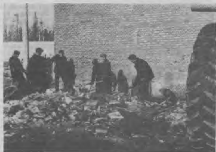
Трудится коллектив ЦТТ.