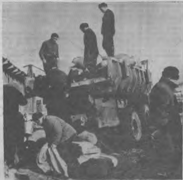
Погрузка кормов для подсобного хозяйства.