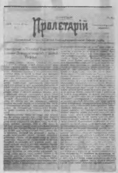
Первая страница первого номера газеты «Пролетарий» — Центрального органа РСДРП.