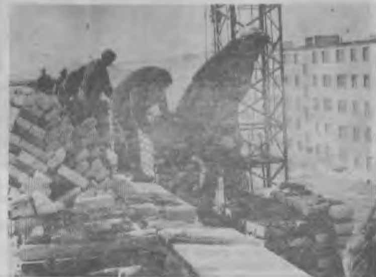
На субботнике — строители города.