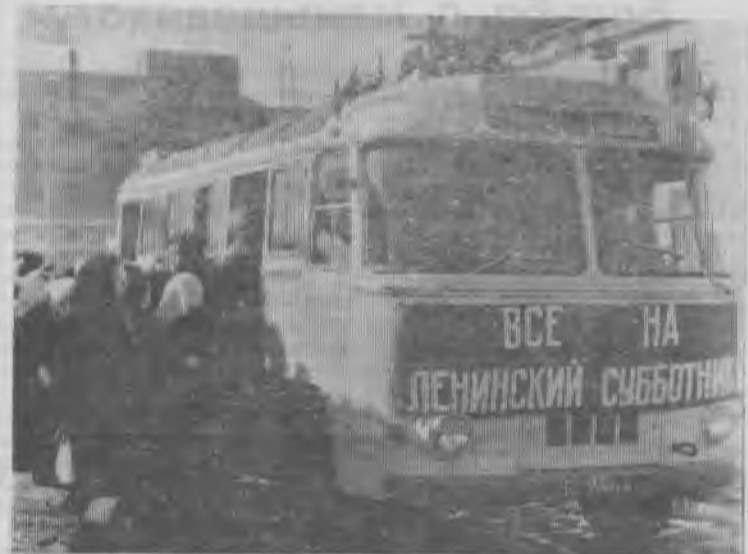
Все на ленинский субботник!