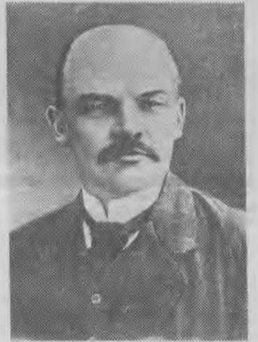
В. И. ЛЕНИН. Фото 1910 г.

В январе 1910 года в Париже состоялся пленум ЦК, на котором борьба большевиков против ликвидаторов разгорелась с новой силой. Дело усложнялось еще и тем, что прибавились настроения примиренчества. Такую позицию заняли Зиновьев, Каменев, Рыков и некоторые другие. Они, как и Троцкий, считали возможной совместную работу с ликвидаторами. Ленин возглавил борьбу с оппортунизмом и его разновидностью — центризмом в международном рабочем движении. Он отстаивал последовательную ре-