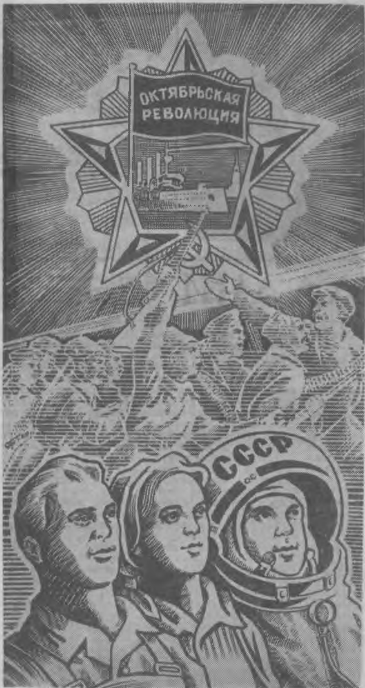
Рисунок художника С.Гринько.

Б. СУЕТИН, секретарь парткома комбината.