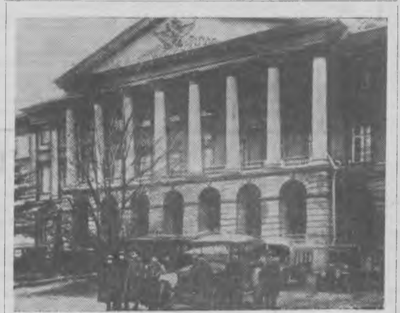
Смольный, октябрь 1917 года.