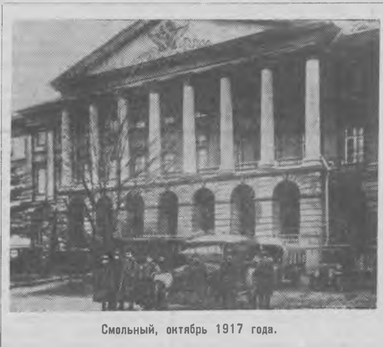
Смольный, октябрь 1917 года.

В первой половине августа 1917 года для большей безопасности ЦК организует переезд Ленина в Финляндию. В парике и гриме, с удостоверением на имя рабочего сестрорецкого завода К. П. Иванова поздно вечером 8 августа Владимир Ильич покидает шалаш, а вечером следующего дня под видом кочевара на паровозе переезжает в Финляндию.