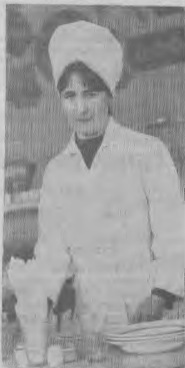
вании за коммунистический труд и за достойную встречу Ленин-