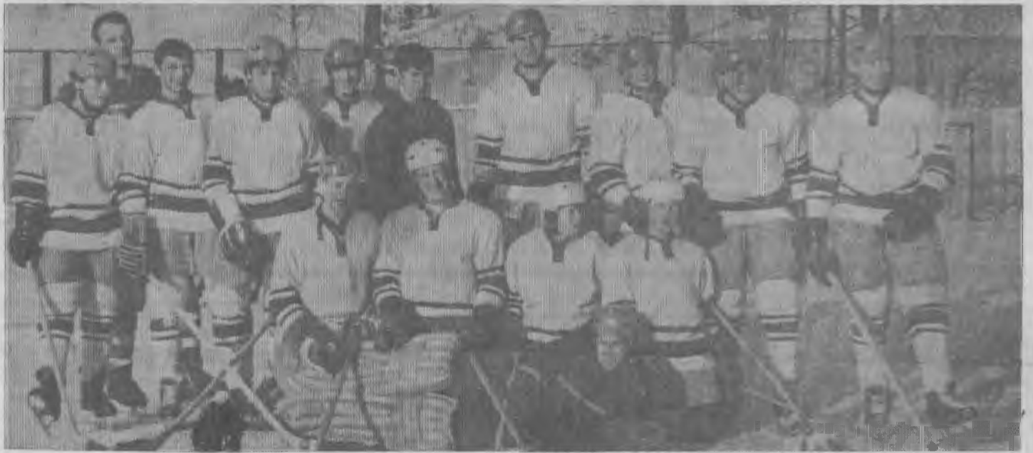
ЧЕМПИОН ОБЛАСТИ НА ПРИЗ «ЗОЛОТАЯ ШАЙБА» КОМАНДА «КОМЕТА».