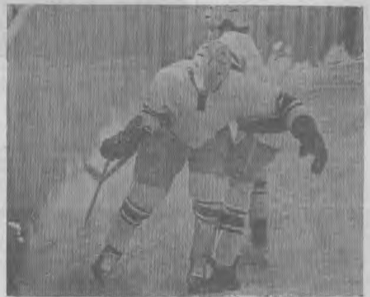
ХОККЕЙ — СПОРТ МУЖЕСТВЕННЫХ.

Фоторепортаж читателя нашей газеты А. ДАНИЛОВСКОГО.