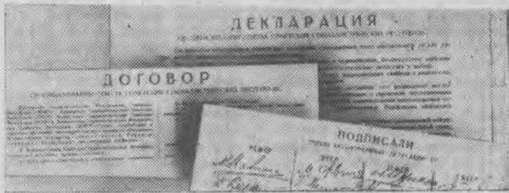
Декларация и Договор об образовании Союза Советских Социалистических Республик, подписанные 30 декабря 1922 года членами полномочных делегаций четырех советских республик.