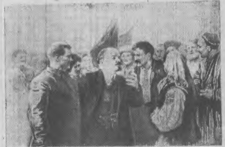
«В. И. Ленин — вдохновитель дружбы народов». Рис. художника Р. Резниченко.

Огромное внимание В. И. Ленина к вопросам образова-