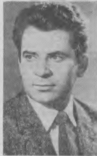
НА СНИМКЕ: БОРИС СПАССКИЙ.

5. Зарубежная литература 1962. Рекомендательный указатель. 1963.