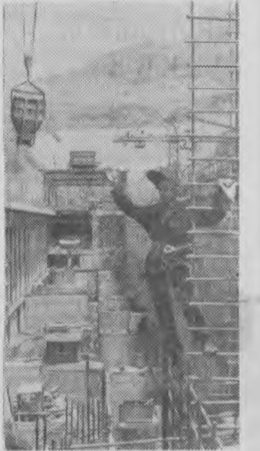
16 ноября наступил долгожданный и торжественный момент.

Гидростроители Нурека дали слово досрочно, 15 ноября этого года, ввести в эксплуатацию первый агрегат станции. Люди, не считаясь со временем, работали днем и ночью. И вот