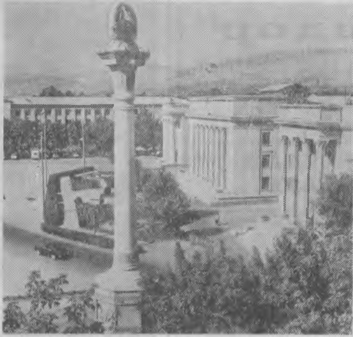
Столица Таджикской ССР — Душанбе. Площадь В. И. Ленина у Дома правительства.

(Из Постановления ЦК КПСС «О подготовке к 50-летию образования СССР»).