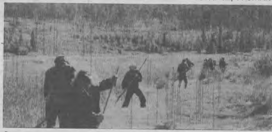
Размахнись, рука, раззудись, плечо...

В. ГОРШКОВ, бригадир строительномонтажного управления «Промстрой-1».