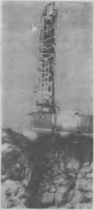
Экипаж машины буровой... Эти люди стоят в голове технологического процесса. В сложных горногеологических условиях выручает крепкая дисциплина, находчивость и смекалка. Днем и ночью, в любых погодных условиях они обеспечивают ритмичную работу участков и цехов.

Г. ОВСЯНИКОВ, горнотехнический инспектор Мурманской РГТИ.