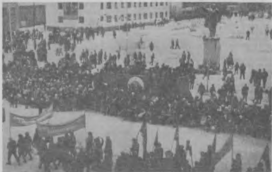
Этот снимок сделан в 11.30 утра 7 ноября во время праздничной демонстрации трудящихся Ковдора.

17 ноября 1974 года состоится выборы судьбы в Апатитский городской народный суд.