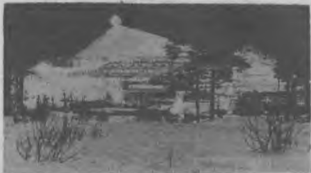
Апатито-бадделейтовская фабрика. В апреле должны быть отгружены потребителям первые тысячи тонн ковдорского апатита.

ИТР участков лично отвечают за уборку металла со взрывных блоков.