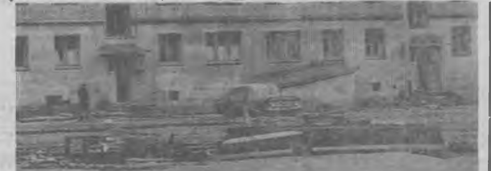
«Благоустройство — забота каждого» — решили жильцы домов Микрорайона № 14 и № 3 по улице Слюдяной и — украсили территорию... хламом.