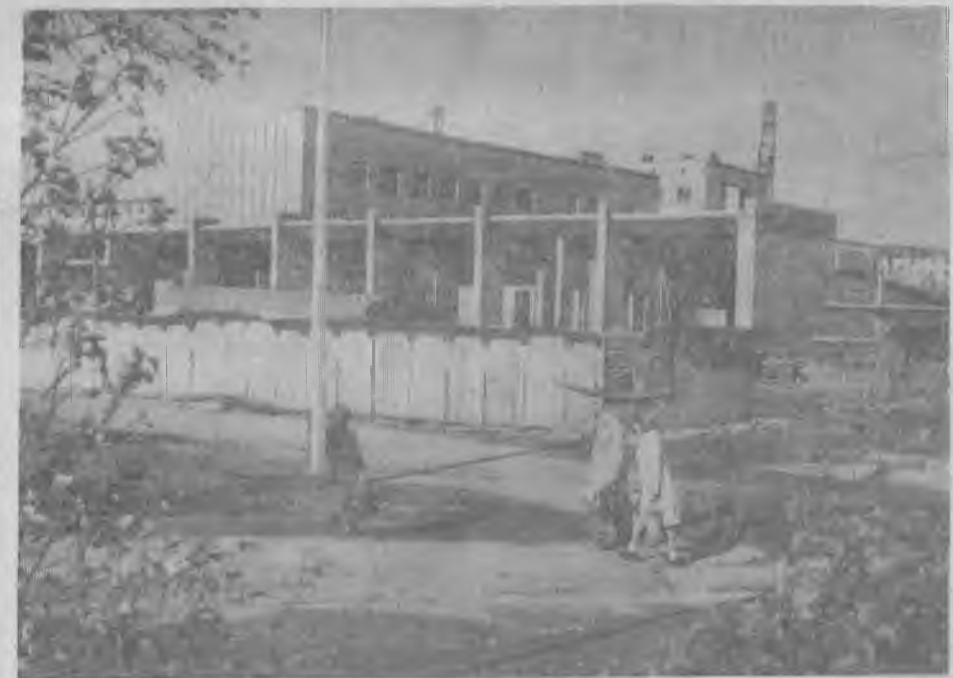
Закончены общестроительные работы на Доме связи. Началась отделка помещений в корпусе электрической связи, прокладывается кабельная канализация.