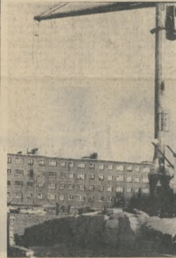
Строится один из объектов десятой пятилетки — городская поликлиника на 600 посещений в день.