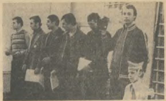
На снимке: команда «Обогатитель», забавлявшая приз «Рудного Ковдора».

Торжественные минуты заключительного парада. Знаменная группа пионеров школы № 18 вносит Переходящий приз редакции газеты «Рудный Ковдор».