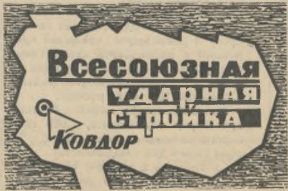
БОЕВОЙ ЛИСТОК «РУДНОГО КОВДОРА»

начальник участка шахтопроходческого управления № 1 треста «Кривбассшахтопроходка».