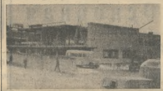
В начале улицы Ленина рядом с промплощадкой строители «Промстрой-1» возводят столовую, в которой смогут одновременно пообедать 330 человек.