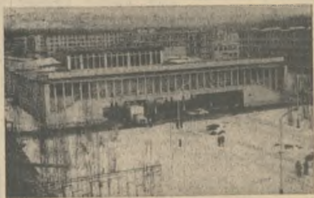
Дворец культуры имени 50-летия Октября.