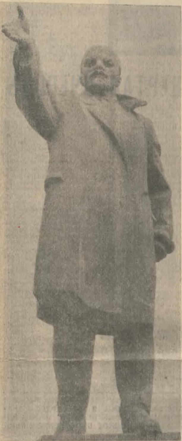
Памятник Владимиру Ильичу Ленину в Ковдоре.