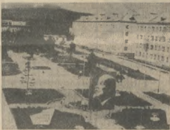
Этому снимку около десяти лет. Такой была раньше площадь Ленина.

Первая сессия первого созыва вновь созданного Ковдорского поселкового Совета депутатов трудящихся была созвана 8 апреля 1957 года, на ней мне выпало счастье быть избранным председателем исполкома Ковдорского по-