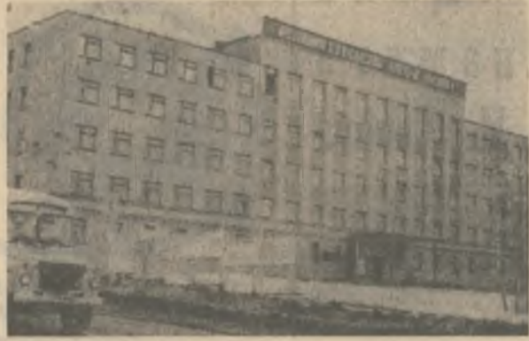
Здание управления Ковдорского ГОКа.